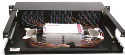
Distribuidor Optronics 2 UR