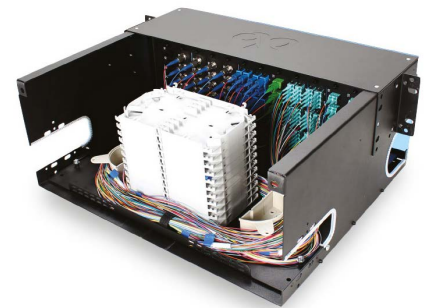
Distribuidor Optronics 4 UR